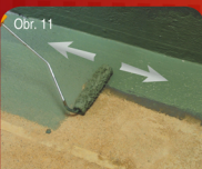
Obr. 11 Nanášení - aplikace / Nanášenie - aplikácia 45 Celoplošná aplikace první vrstvy. Celoplošná aplikácia prvej vrstvy.