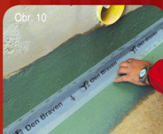
Obr. 10 Nanášení - aplikace / Nanášenie - aplikácia 35 Do prvního nátěru vložte Tesniční pásy a rohy. Do prvého nátěru vložte Tesniace pásy a rohy.