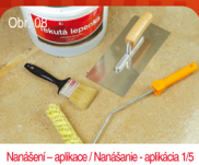
Obr. 08 Nanášení - aplikace / Nanášenie - aplikácia 15 Příprava nářadí - váleček na disperze, štětec nebo ocelové hladítko. Příprava náradia - váleček na disperzie, štetec alebo oceľové hladítko.