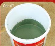
Obr. 07 Příprava směsi / Příprava směsi 55 Důkladná homogenizace obou složek. Dôkladná homogenizácia oboch zložiek.