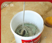
Obr. 06 Příprava směsi / Příprava směsi 45 Promísení obou složek. Premiešanie oboch zložiek.