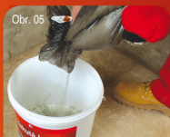
Obr. 05 Příprava směsi / Příprava směsi 35 Vysypání sypké složky do složky tekuté. Vysypanie sypkej zložky do zložky tekutej.