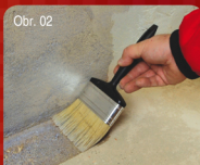
Obr. 02 Příprava podkladu / Příprava podkladu 22 Penetrace podkladu, sjednocení savosti. Penetrace podkladu, zjednotenie savosti.