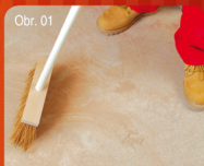
Obr. 01 Příprava podkladu / Příprava podkladu 12 Zbavit podklad prachu a volných částic. Zbavit podklad prachu a volných částic.