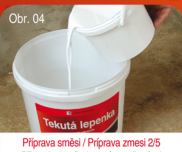
Obr. 04 Příprava směsi / Příprava směsi 25 Připravit si požadované množství od každé složky pro jednotlivé nátěry. Připravit si požadované množstvo od každej složky pre jednotlivé nátěry.