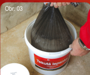
Obr. 03 Příprava směsi / Příprava směsi 15 Vyšňout z balení obě složky, syplku a tekutou. Vyšňout z balenia obe složky, syplku a tekutú.